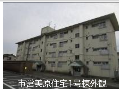
市営美原住宅1号棟外観