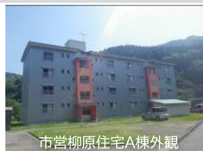
市営柳原住宅A棟外観