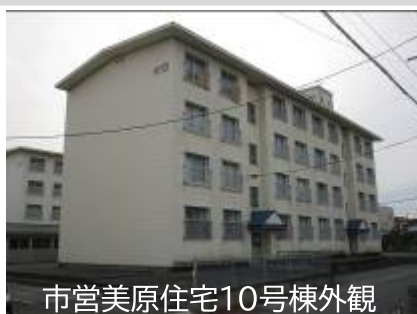
市営美原住宅10号棟外観