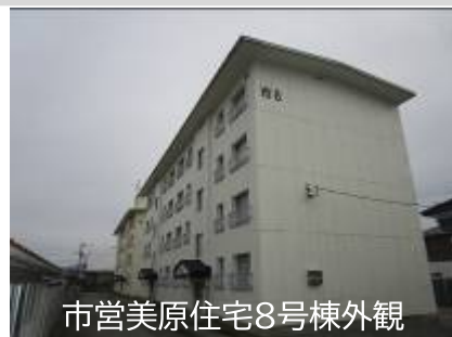
市営美原住宅8号棟外観