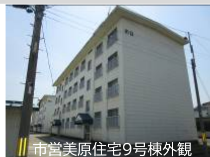
市営美原住宅9号棟外観